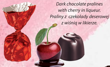
Dark chocolate pralines with cherry in liqueur. Praliny z czekolady deserowej z wiśnią w likierze.