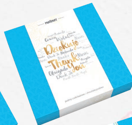
FOR CHOCO & TRUFFLE INDEX 4415V