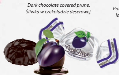
Dark chocolate covered prune. Śliwka w czekoladzie deserowej.