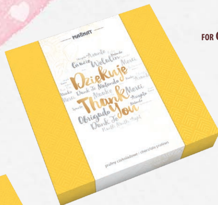
FOR CHOCO & VANILLA INDEX 4422V