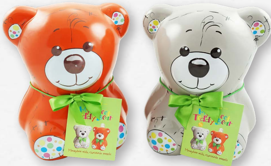
SWEET TEDDY BEAR MONEY BOX / SKARBONKA Jelly in chocolate. Galaretki w czekoladzie.